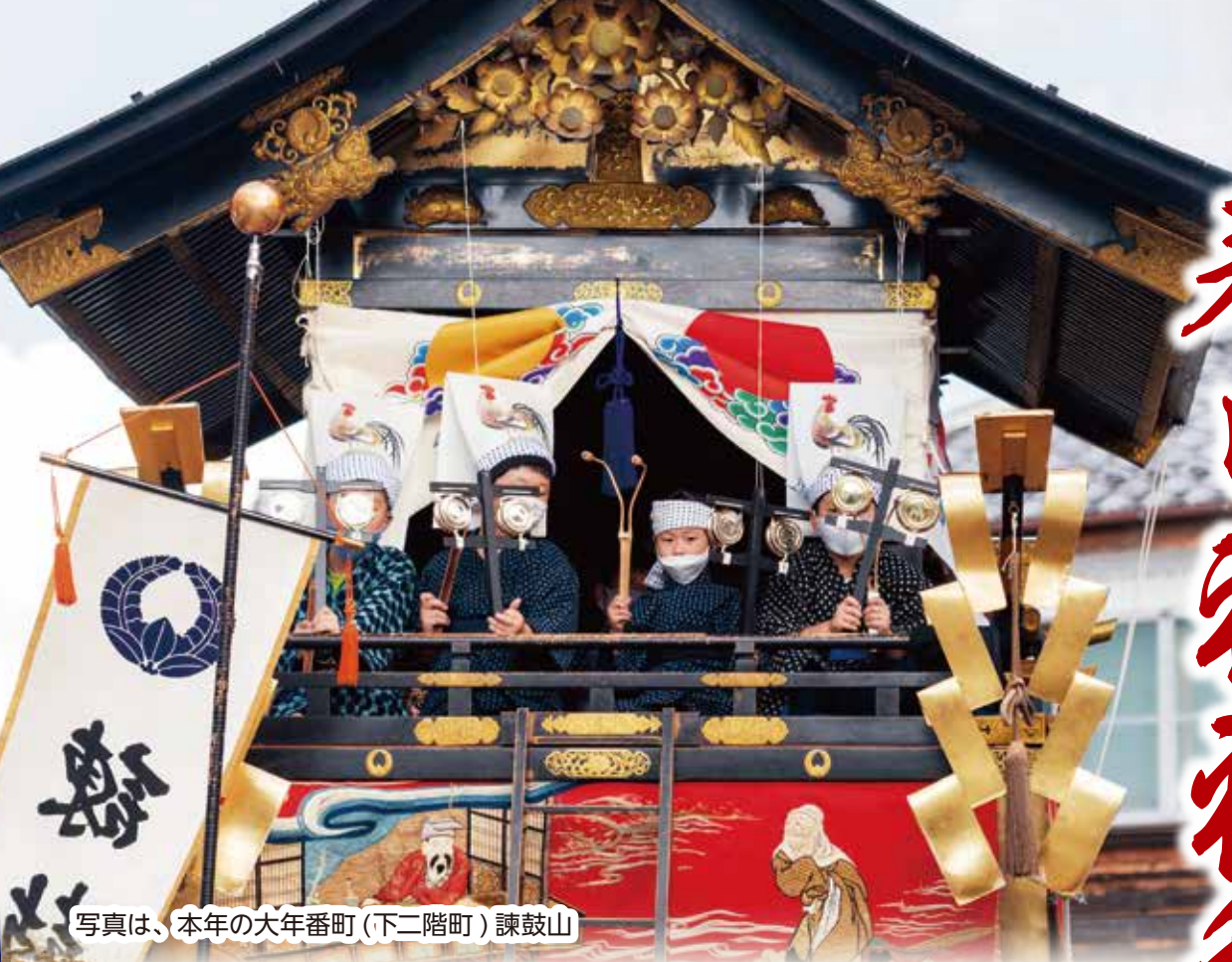
写真は、本年の大年番町(下二階町)諫鼓山